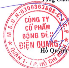
Hồ Quỳnh Hưng